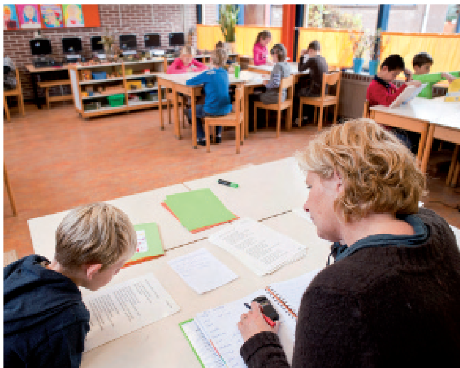
Human Touch Photography

Wat de praktijk van het leesonderwijs betreft lijkt het lezen te veel een wedstrijd te zijn geworden: wie snel en foutloos leest, leest goed. Dat heeft de toegepaste didactiek ook mede veroorzaakt. Het herhaald lezen heeft zijn intrede gedaan als een belangrijke interventie om het geautomatiseerd decoderen te ondersteunen. De laatste generatie methodes voor technisch lezen passen dit in ruime mate toe in de gehanteerde didactiek. Het proces van het herhaald lezen kan voor leerlingen heel motiverend zijn en leiden tot daadwerkelijk vlotter lezen van andere teksten, waarin op vergelijkbaar instructieni-